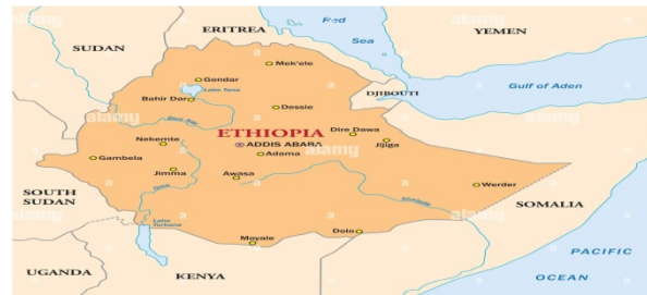
Gambar 1. Peta Ethiopia

Awalnya, warga sipil khususnya di wilayah Tigray mencari perlindungan dengan pergi dari kota ke kota seperti Shire, Mekelle, Sheraro, Adwa, Askum dan beberapa kota lainnya di Negara Bagian Afar dan Amhara. Namun, situasi dalam negeri yang semakin tidak aman memaksa mereka untuk meninggalkan negaranya dan mencari perlindungan ke negara tetangga.